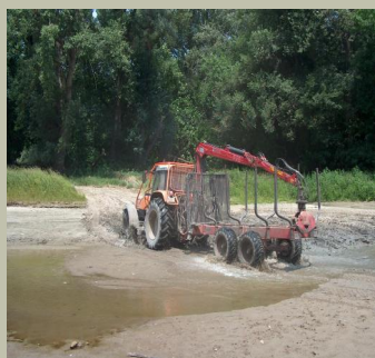
Rekonstrukcija rijeka, Kopački rit, Hrvatska

Osiguravanje povezanosti močvarnih područja pridonosi retenciji vode i kontroli poplava.