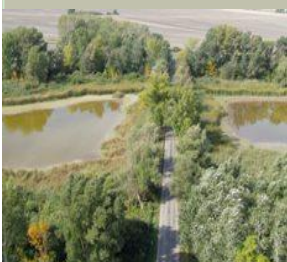
Nacionalni park Dunav - Drava, Mađarska

Proglašavanje zaštićenih područja za šumske dijelove ekološke mreže visoke vrijednosti, održivo upravljanje šumama i pošumljavanje autohtonim vrstama gdje je prikladno, pridonosi pospješivanju prirodnih funkcija šuma. Dijelovi šuma mogu biti povezani sadnjom ili održavanjem šumskih dijelova i traka kao ekoloških koridora. Ostale važne aktivnosti uključuju uvođenje sustava zoniranja šuma temeljenog na principima ekosustava.