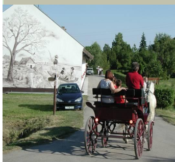
Kočija na području ribnjaka prolazi uz ribovoljni muzej, Reitszilas, Mađarska

Unaprjeđenje prirodnih područja pojačava i turističku i rekreacijsku vrijednost područja te podiže razinu svijesti o ekološkoj povezanosti. Stvaranje planinarskih, pješačkih i biciklističkih staza uz rubove polja, jezera, obala rijeka ili unutar šuma, uspostava kampova te seoskog turizma ili obnova starih tradicionalnih građevina te njihova prenamjena u centre za posjetitelje, otvaranje vrtova i javnih parkova samo su neki od primjera koje treba razmotriti.