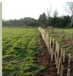
Rekonstrukcija živica, Essex, Velika Britanija

Poboljšanje prirode u poljoprivrednim dijelovima može se postići na razne načine. Pretvaranje monokultura u mozaični tip zemljišta, pošumljavanje rubnih dijelova obradivih površina autohtonim vrstama, zamjena pesticida biološkim načinima kontrole štetnika, osiguravanje širokih rubnih područja za travnjačke vrste, te sadnja živica povećavaju prirodnost poljoprivrednih površina.