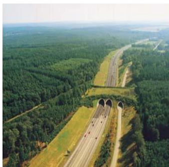
Zeleni most na autocesti A50, Nizozemska

Ovim putovima uglavnom se služe veliki sisavci. Gdje je to moguće, uklanjanje infrastrukture iz prirodnih područja također može predstavljati opciju.