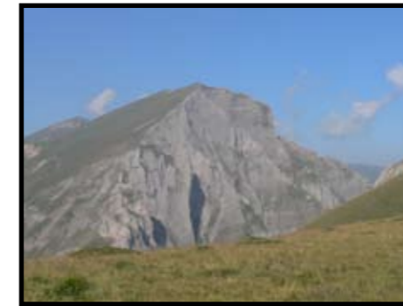
Šar Planina Lesnica

Картата не може да се користи за донесување заклучоци во врска со вистинската местоположба и граници на клучните области и коридори од Пан-европската еколошка мрежа или местоположбата на (интер)националните заштитени или предвидени за заштита подрачја. Картата не сугерира дека идентификуваните области треба да се заштитат со меѓународни или национални инструменти за заштита, ниту пак сака да коментира или влијае на начинот со кој националните влади го применуваат своето суверено право за определување на области за зачувување на природата.